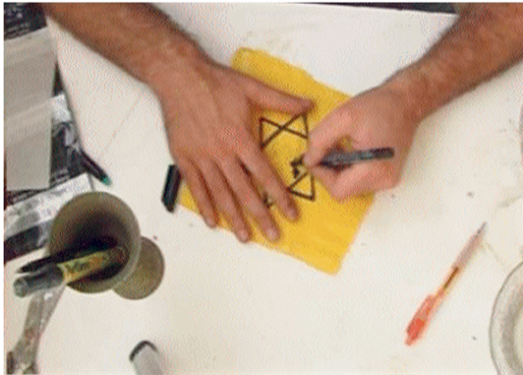
ישראלי תופר על עורו טלאי צהוב