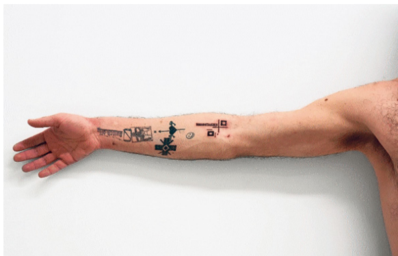
אחת היבודות שמכרו. קעקועי חותמות של מועדון הברגהיין