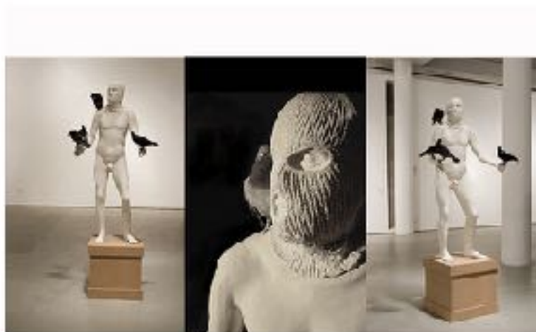
"BROOKLYN" 1999, Jeff Koons, mixed media, wood & stuffed paper, 100 x 100 x 100 cm, 2009

דרור מפוחלצת מתייחס באופן אירוני לפסלי חוצות מונומנטאליים ולביטויים של הרואיות גברית, המוכרת מהתרבות המערבית (גטמלטה של דונטלו) והישראלית (אלכסנדר זייד). כך גם הטרוריסט, (2007, יציקת אפוקסי ופוחלצים), וראשים, מיצב פיסולי מונומנטאלי של ראשי טרוריסטים יצוקים בבטון המונחים על הקרקע כמו שרידים ארכיאולוגיים של העתיד.