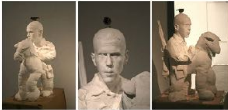
"BROOKLYN" 1999, Jeff Koons, mixed media, sculpture, 100 x 100 x 100 cm, 2009

דרור מפוחלצת מתייחס באופן אירוני לפסלי חוצות מונומנטאליים ולביטויים של הרואיות גברית, המוכרת מהתרבות המערבית (גטמלטה של דונטלו) והישראלית (אלכסנדר זייד). כך גם הטרוריסט, (2007, יציקת אפוקסי ופוחלצים), וראשים, מיצב פיסולי מונומנטאלי של ראשי טרוריסטים יצוקים בבטון המונחים על הקרקע כמו שרידים ארכיאולוגיים של העתיד.