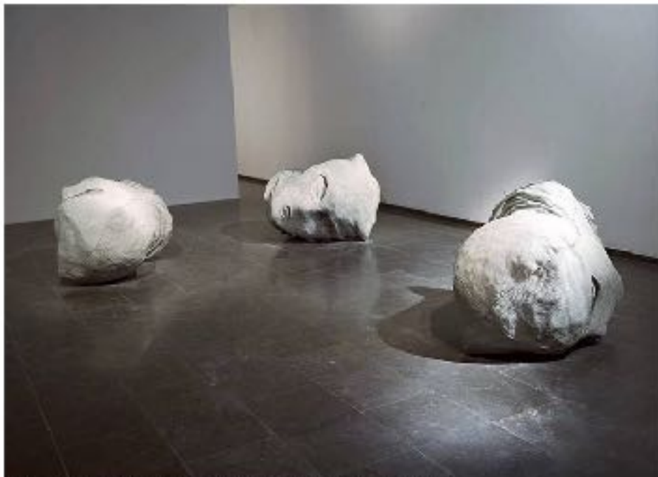
HEADS, series from "1001 Days Art in Israel, 1997-2000", concrete and fabric, 2007 The Israel Museum Collection

ולמיתוסים מערביים, באופן שהופך את עיסוקו במקומי ובפוליטי לעיסוק באנושי.