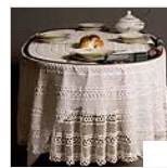
שולחן השבת של ישראל: צילום: ליאת שחר