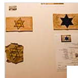
ליל שיש: בין ההיבט האומנותי לתרבותי לייצג שחר

בעבודה "לצעוד לצד שרוכי געליים במקרה ריק" הקינה אקרמן קטע מטקסט שהקריאה אימא שלה. הטקסט נלקח מתוך יומן נעורים בפולנית שכתבה סבתה שנספתה באושוויץ. בדיבור על השואה כאירוע מוכן מדגישים את אובדן היכולת לספר סיפור שלם וקוהרנטי ולייצג את מה שלא ניתן לייצג. שתייה למעשה ייצרו פסיפס זיכרון ומלא פערים בזמן, כשהן נוגעות בחומרים הטעונים בצורה פואטית.