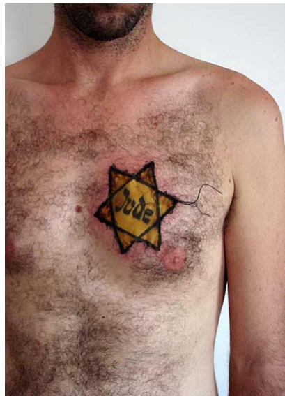
ישראלית. אין פואטיות מהוררת או ביוגרפיה

בתערוכה של ארץ ישראל פואטיות מהוררת או עיסוק בביוגרפיה; ישראלית אינו סוגר מעלים בין דוריים ונאולוגיות משפחתיות, אבל מתייחס למימד הזמן ולהקפאתו. במיצב בקומת הכניסה, הבנוי כמו תפארת תזאטרון או שריד מפרפורמנס, חנה על השולחן רכבת צעצוע הנושאת סמל א.א.א.