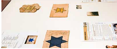
"פועל בתוך ההיסטוריה של שנות ה-70". מתוך התערוכה

למעשה, התערוכה של ישראל משתמשת באסטרטגיה של הרחקה בכל מה שנוגע לסמלים טעונים ולדיבור על שרידים; היא כותבת ומוחקת, מפעילה אצל הצופה רגש חדהות ומיד מעקרת אותו, והצופה עובר סוג של מסלול הליכה המסתיים בקומה השנייה בקערת מרק.