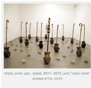
"אדמה נמוכה" מיצב, 2011-2012, אפוקסי, בטון, חוטים, מקלות הליכה, גדלים משתנים.

לדבר על מרחק ושינוי, חלשים לעומת משקל העבר. עצם היות התערוכה תוצאה של שהות בגרמניה, חלק ממערך הקשרים המטופח והחשוב שנרקם משך השנים, אינו משנה את העובדה שלעת עתה מדובר רק בהידפקות על סף הפיכת העבר ל"עבר" ממש, דבר שהוא כפי הנראה רחוק משהעריכו בעבר.