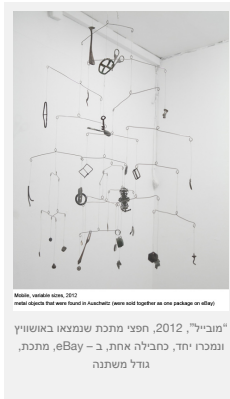
Mobile, Smadar Sheffi, 2012 "מובייל", 2012, חפצי מתכת שנמצאו באושיוץ ונמכרו יחד, כחבילה אחת, ב- eBay, מתכת, גודל משתנה

עבודה אחרי עבודה מנכיחה את האופן בו זועת העבר שולחות אצבעות להווה. "מובייל" היא עבודה שנעשתה מחפצי מתכת שנמצאו באושיוץ ונמכרו ב- eBay. בקומת הכניסה בנה ישראלי במה ועליה פיוגמים המחזיקים ציורי נוף שלווים של הריון, שצוירו בתקופת המלחמה על ידי ציירים