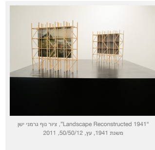
"Landscape Reconstructed 1941", ציור נוף גרמני ישן משנת 1941, עץ, 50/50/12, 2011

גלריה גבעון, רחוב גורדון 35, תל אביב, 03- 5225427 עד 3/11/2012