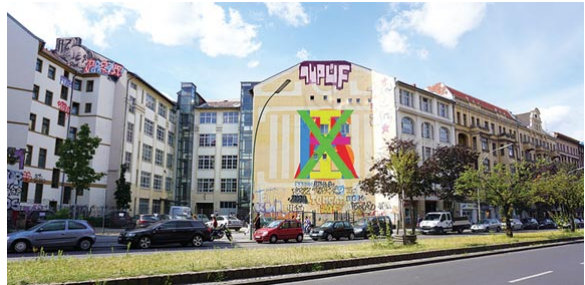
עבודת הקיר של זיידמן בברלין