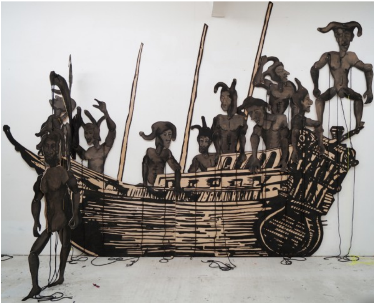
Erez Israeli: Ship of Fools, 2015, Tinte auf Holz, Seil, 339 x 399 x 134 cm, © Erez Israeli, Courtesy Galerie Crone, Berlin

In der Ausstellung in der Galerie Crone zeigt Erez Israeli Werke in verschiedene Medien und Techniken. Größte und auffälligste Arbeit ist zweifellos "Ship of Fools", Israelis Adaption des mittelalterlichen "Narrenschiff"-Themas. Beinahe schon ein Relief, ist das aus schwarzer Tinte auf Holz und Seil-Details bestehende Werk über drei Meter breit. Mit durchaus erkennbarem Bildbezug auf die Holzschnittillustrationen des spätmittelalterlichen Narrenschiffs des Sebastian Brant zeigt es zehn nackte, marionettenartige Männerfiguren mit Narrenkappen auf den Köpfen, die das titelgebende Schiff bevölkern. Mit ihren fragmentierten Körpern, den sichtbar verschraubten Gelenken und den von ihren Extremitäten herabhängenden Seilen erinnern sie an Hampelmänner – die teils gegen alle Gesetze der Schwerkraft von ihren Köpfen aufragenden Narrenkappenzipfel sind dagegen ganz eindeutig phallischer Natur, ebenso wie der penisartig geformte Bug des Schiffes.